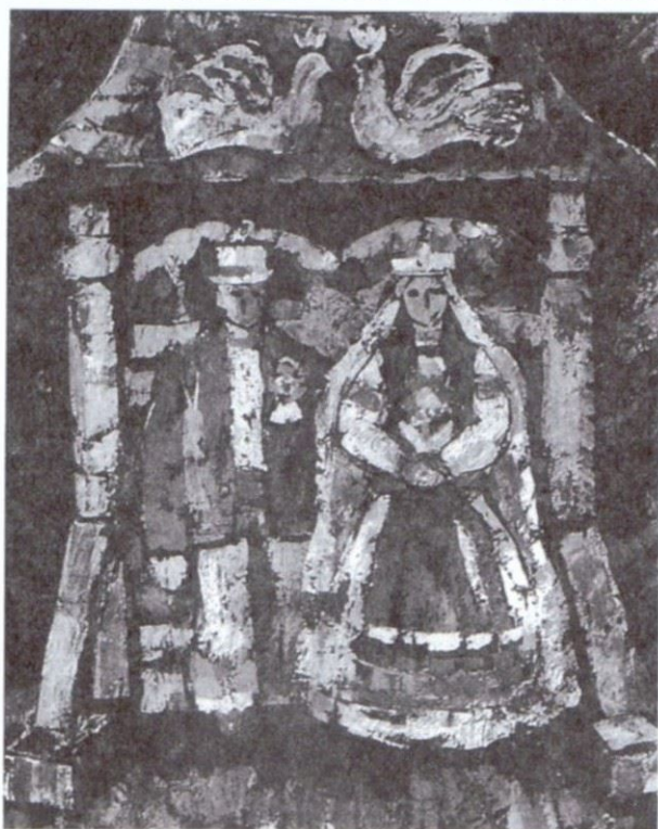
Юрій Герц. Молоді перед брамою (1990)

Від виставки до виставки про митця лунають схвальні відгуки. Його мистецтво