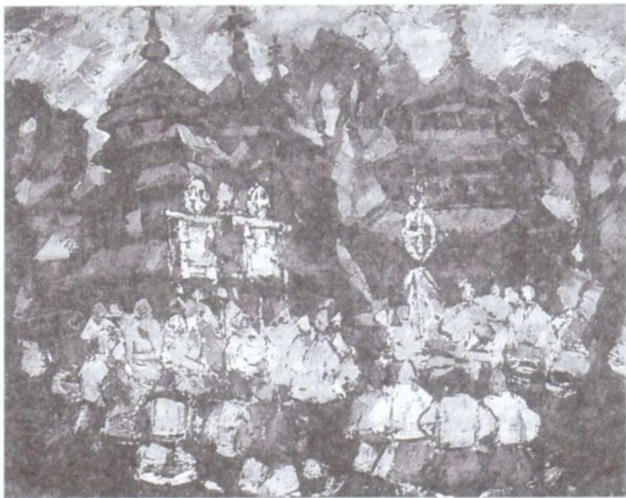
Юрій Герц. Пасхальна ніч (1992)

повісила у себе в майстерні. Її поетичному серцю вона говорила багато!