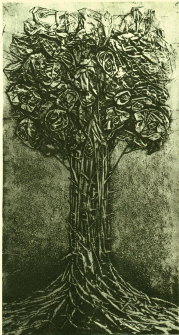
ТРОЯНДА І МОРОЗ